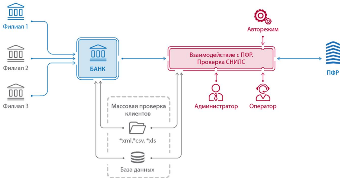
Рисунок 1. Архитектура решения

Архитектура решения для использования в интеграции с внешними информационными системами представлена на рисунке 1.