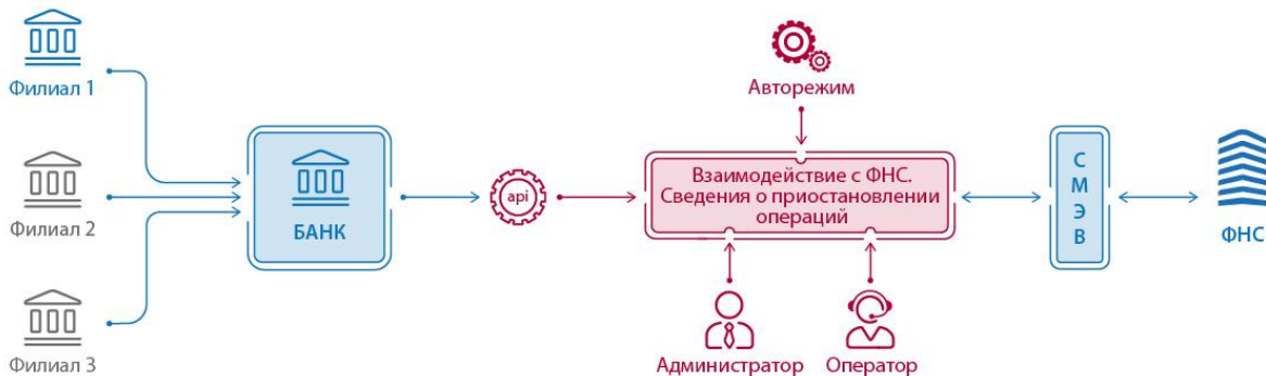
Рисунок 1. Архитектура решения

Архитектура решения для использования в интеграции с внешними информационными системами представлена на рисунке 1.