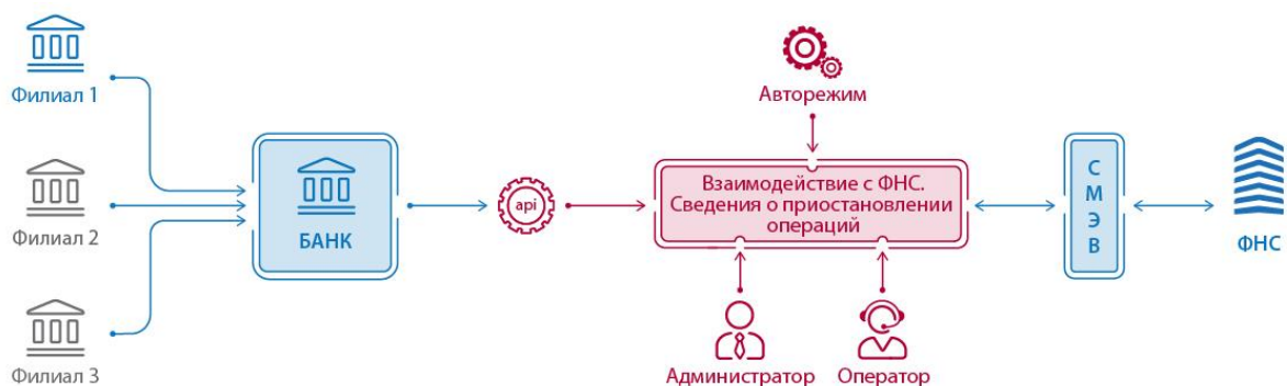
Рисунок 1. Архитектура решения

Архитектура решения для использования в интеграции с внешними информационными системами представлена на рисунке 1.