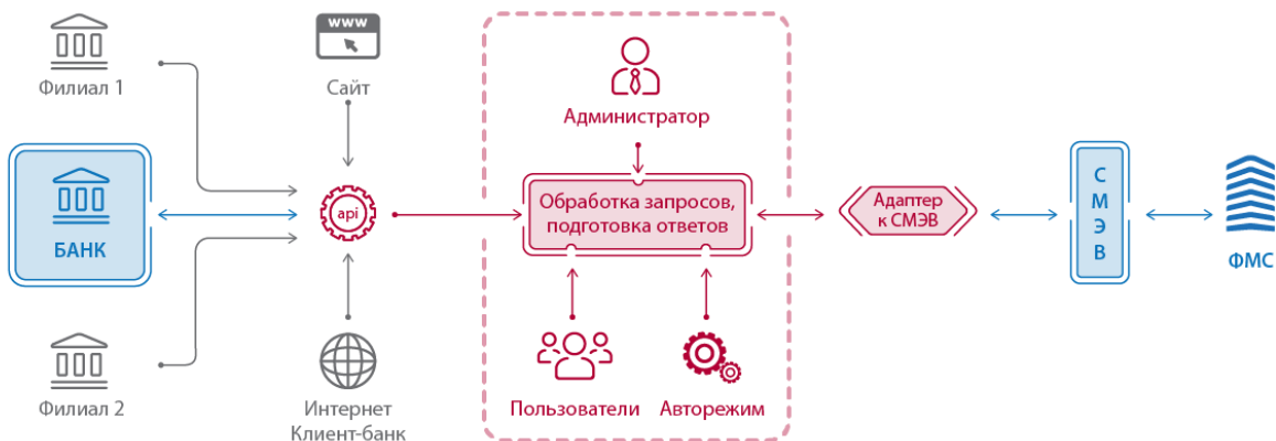
Рисунок 1. Архитектура решения

Архитектура решения для использования в интеграции с внешними информационными системами представлена на рисунке 1.