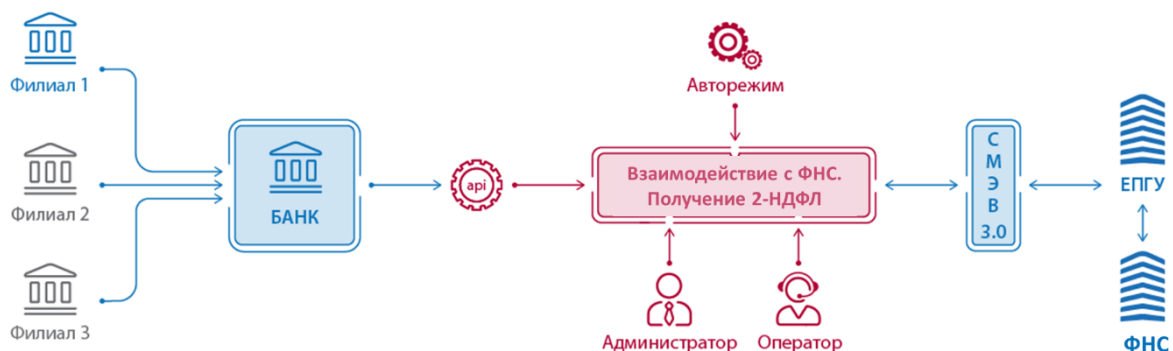
Рисунок 1. Архитектура решения

Архитектура решения для использования в интеграции с внешними информационными системами представлена на рисунке 1.