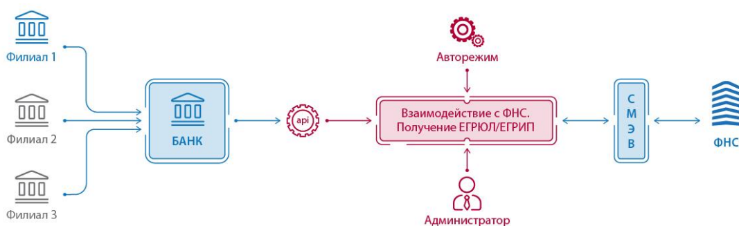
Рисунок 1. Архитектура решения

Архитектура решения для использования в интеграции с внешними информационными системами представлена на рисунке 1.