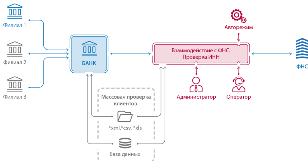
Рисунок 1. Архитектура решения

В данной архитектуре решение обеспечивает: