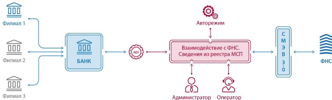
Рисунок 1. Архитектура решения

Архитектура решения для использования в интеграции с внешними информационными системами представлена на рисунке 1.